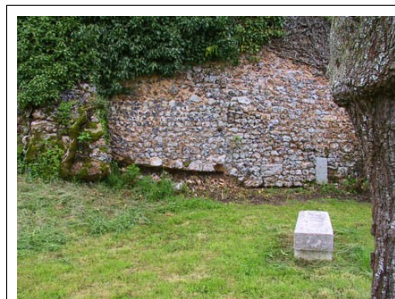
Une seule exception : le lierre « site inscrit » de l'église de Champignolles. Il est protégé depuis 1932, à une époque où les dégâts dus au lierre n'étaient pas aussi bien connus qu'aujourd'hui.

Pour de tels travaux, le coût peut être très important et c'est pourquoi il ne faut pas attendre d'avoir des « monstres » qui envahissent les murs avant d'agir. Il convient d'enlever le lierre dès l'apparition de la première petite branche.